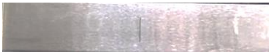
Рисунок 2 – контрольный образец

Примечание. Контрольный образец дефектов для магнитопорошкового контроля приобретается дополнительно (рис.2).