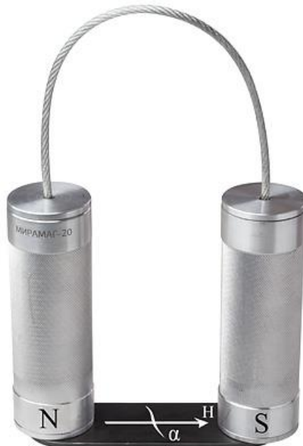
Рисунок 4 – схема обнаружения дефектов

5. Для съема намагничивающих цилиндров с изделия, необходимо наклонить цилиндр на 20-30^\circ в сторону и подложить под полюсный наконечник немагнитную пластину толщиной 3-5 мм, устранить наклон цилиндра и снять его с изделия.