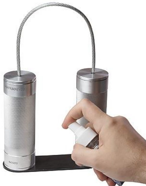
Рисунок 3 – нанесение суспензии на контролируемый участок

2. Нанести на контролируемый участок изделия суспензию для магнитопорошкового контроля (рис. 3).